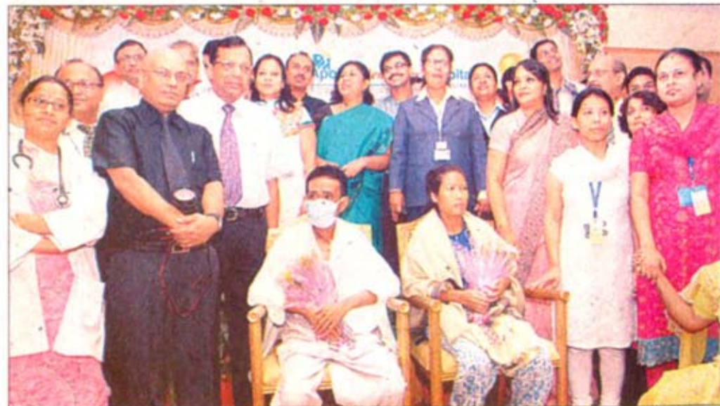
मरीज के साथ अस्पताल की टीम